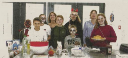
L'équipe presque complète des jeunes et leurs encadrants ayant œuvré pour concrétiser leur projet.

Au programme : visite du musée Grévin, exploration des catacombes, ascension de la tour